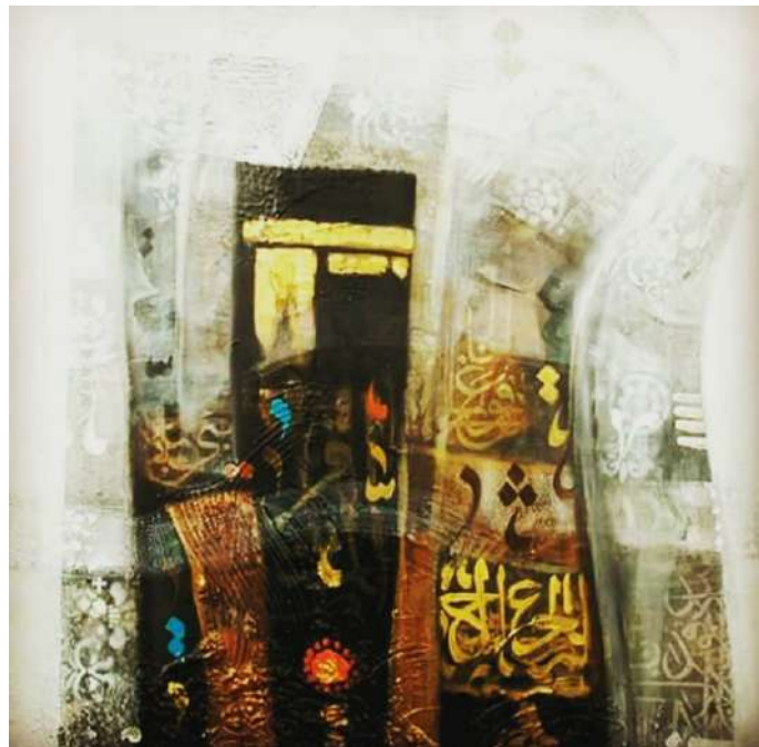
شكل (12) عبده فايز- الوان اكريلك على كانفس 80x80-2019م. ( اللوحة من الفنان مباشرة)