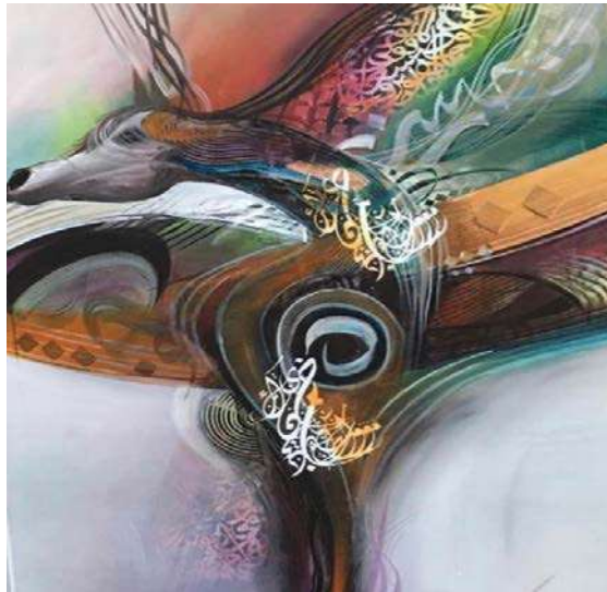
شكل (1) عبد الله الرشيد- ألوان أكريليك على قماش كانفس- ١٢٠ x ١٤٠ سم- 2012 م. ( اللوحة من الفنان مباشرة)

والتأمل للعمل نجد مدى تمكن الفنان في دمج الحروف العربية مع عنصر الخيل مما اكسب اللوحة قيم جمالية وتشكيلية استطاع من خلالها الفنان تحقيق قيماً تعبيرية تصل لذائقة المتذوق للعمل الفني. كما أن الحروف العربية اكسبت اللوحة التجريدية الخالية من الملامح والمعبرة بالأسلوب التجريدي جمالاً ورشاقة الخيل العربي الأصيل، واستشعار حركاته ونظراته. كما يتبين مدى قدرة وتمكن الفنان من استخدام ادواته ليظهر مجموعة من التقنيات المتعددة على سطح هذه اللوحة، كما تمكن الفنان في توصيل هذه المفاهيم من خلال تكوين متناغم نابض بالدف والاحتواء، بأسلوب الفنان وتقنياته اللونية المميزة واللمسات البارزة التي تضيف بعداً جمالياً وتقني على سطح اللوحة، ذلك الأسلوب المتناغم الرقيق النابض بالحركة والحياة المتجانس بألوانه وبأساليبه وتقنياته الذي يظهر عمق تجارب الفنان في هذا المجال.