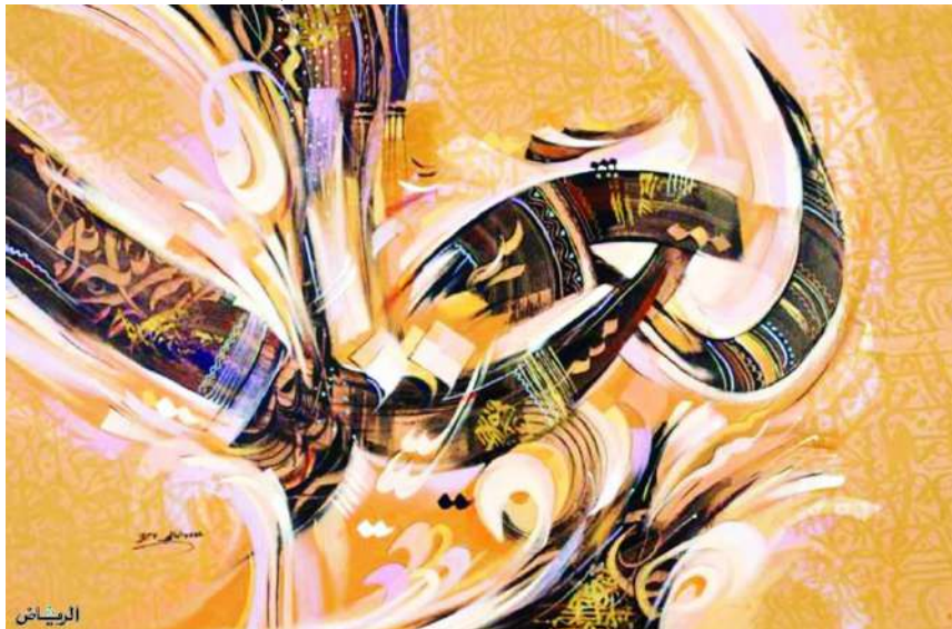
شكل (7) محمد الرباط 120x100 أكريلك وأحبار على كانفس 2017م. ( اللوحة من الفنان مباشرة)