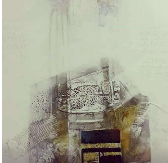
شكل (11) عبده فايز- الوان اكريلك على كانفس 80x80-2019م. ( اللوحة من الفنان مباشرة)