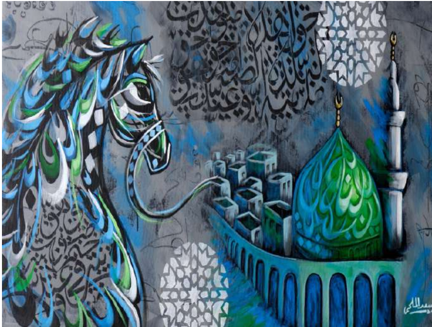
شكل (9) سعد الملحم – طيبة – الوان اكريلك على كانفس – المقاس 60x120-2018م. ( اللوحة من الفنان مباشرة)