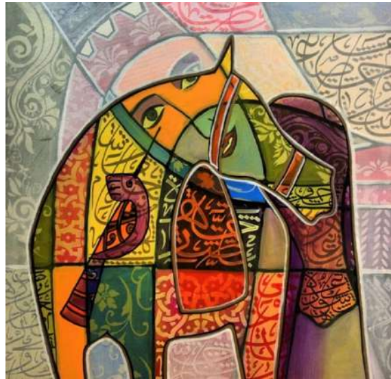
شكل (2) محمد شراحيلى -الوان اكريلك على كانفس -2013م. ( اللوحة من الفنان مباشرة)