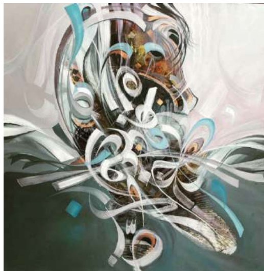
شكل (17) عبدالله الرشيد-صهيل حرف -الوان اكريلك على كانفس - 76×76سم-2020م ( اللوحة من الفنان مباشرة)