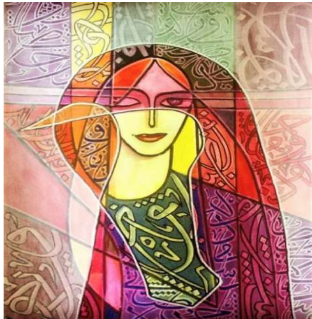
شكل (3) محمد شراحيلى -الوان اكريلك على كانفس – 2014م. ( اللوحة من الفنان مباشرة)