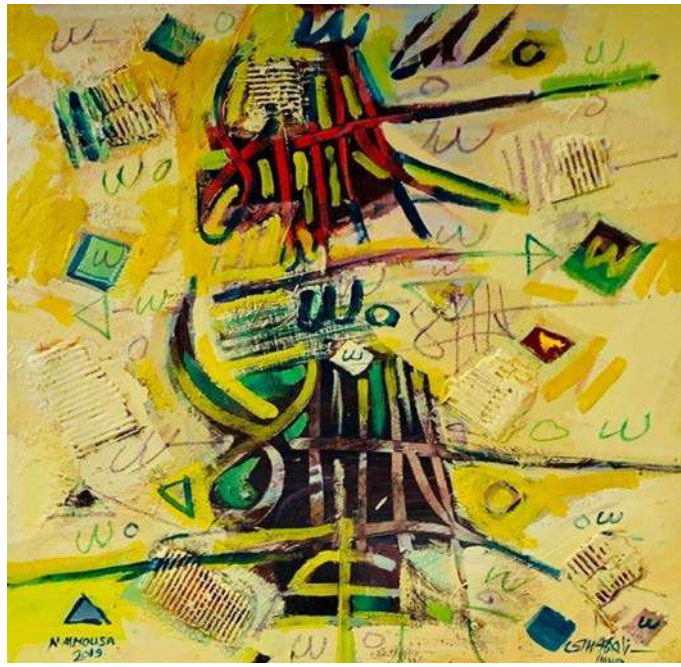
شكل (13) ناصر الموسى -الوان اكريلك على كانفس- 100x100سم -2019م. ( اللوحة من الفنان مباشرة)