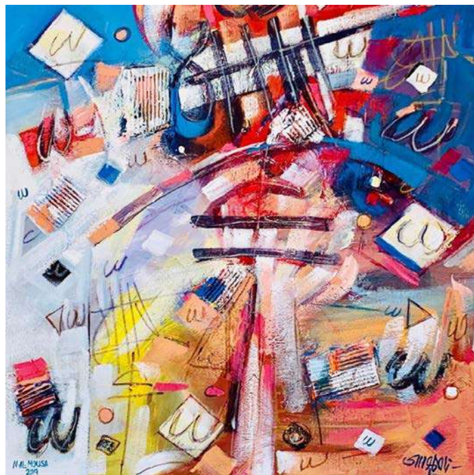
شكل (14) ناصر الموسى -الوان اكريلك على قماش -100x100سم -2019م. ( اللوحة من الفنان مباشرة)