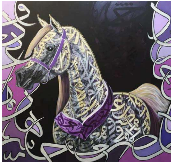
شكل (10) محمد شراحيبي - الوان اكريلك على كانفس - 100x100سم -2018م. ( اللوحة من الفنان مباشرة)