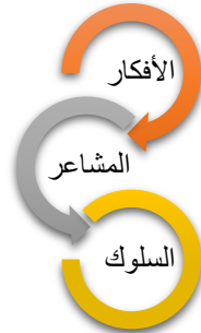
شكل (2): نموذج ABC (Ellis & Bernard, 1985)

وعرض بيك أصول نشأة الأفكار للاعقلانية للمعتقدات "إذا لم تتغير المعتقدات، فلا يوجد تحسن. إذا تغيرت المعتقدات، تتغير الأعراض؛ إذ تعمل المعتقدات كوحدات تشغيلية صغيرة " مما يعني أن أفكار الفرد ومعتقداته (المخطط) تؤثر على سلوكه وأفعاله اللاحقة وكان يعتقد أن السلوك غير الفعال ناتج عن خلل في التفكير وأن التفكير يتشكل من خلال معتقداتنا ومعتقداتنا هي من تقرر مسار أفعالنا؛ لذلك كان بيك مقتنعاً بالنتائج الإيجابية إذا أمكن إقناع المرضى بالتفكير البناء والتخلي عن التفكير السلبي (Beck, 1979). وحدد (Beck et al., 1979) أن التشوهات في التفكير تشمل: الانتباه الانتقائي والاستدلال التعسفي والتعميم المفرط. وبعدها قام بيرنس بتسميتها بلغة يومية أكثر: على سبيل المثال القفز إلى الاستنتاجات، والتفكير الكل أو لا شيء، والتفكير العاطفي، ومع ذلك، على الرغم من أنه يمكن تعليم الناس بسرعة كبيرة كيفية تحديد "الأخطاء والتشوهات المعرفية" (Burns, 1980). لذلك قد تعكس التشوهات المعرفية حقيقة أن الدماغ تطور بالفعل لتشويه معالجة المعلومات في العديد من السياقات- لاستخدام الاستدلال والتحيزات بدلاً من الأساليب الاستنتاجية المنطقية (Buss, 1995; Krebs & Denton, 1997).