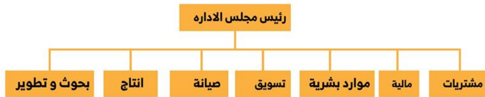
شكل 1: يوضح نموذجا لاحدي الهياكل التنظيمية للمؤسسات (www.reseachgate.com)